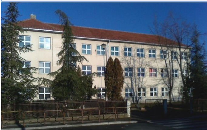
Садашњи изглед школе

Новости из школског спорта и живота: ЕКСКУРЗИЈА, „ЧАРОВНА ФРУЛА“, СТОНИ ТЕНИС, АТЛЕТИКА, Једна од нас: ИНТЕРВЈУ СА УЧЕНИЦОМ 7 2 АНИЦОМ ИЛИЋ, РЕПРЕЗЕНТАТИВКОМ СРБИЈЕ У ГИМНАСТИЦИ.... СТРАНА 2