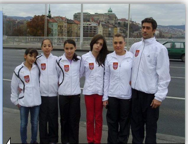
Аница са репрезентацијом Србије