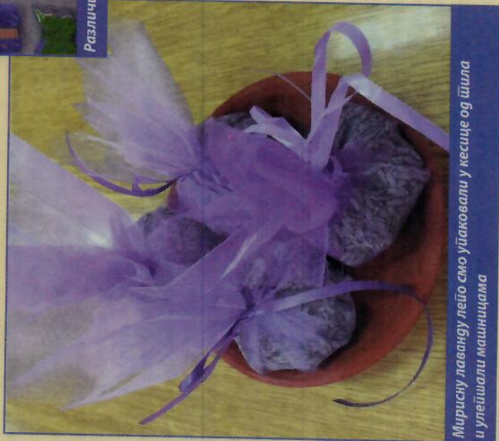
Мирисну лаванду лепо уйкавали у кесице од тила и улепшали машиницама