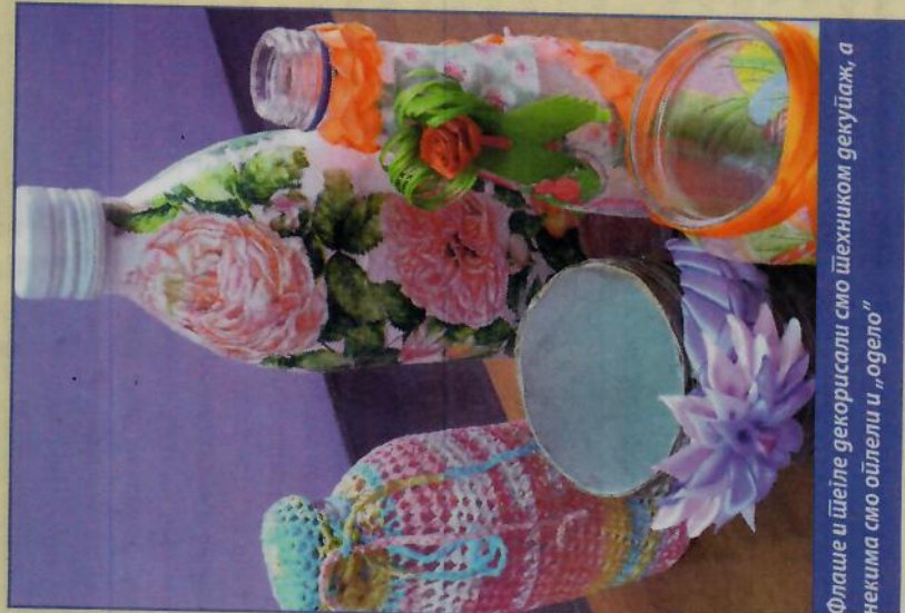
Флаше и штеље декорисали смо шехником декупаж, а неким смо ојтели и „одело“