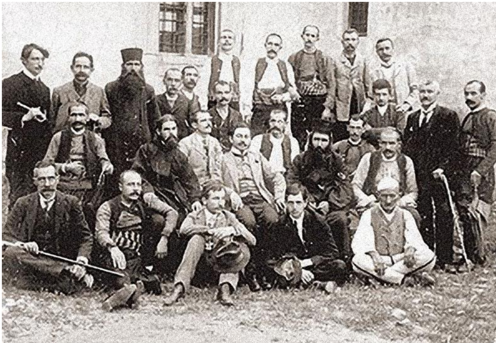
Милан Ракић је умро 30. јуна 1938. у Загребу.