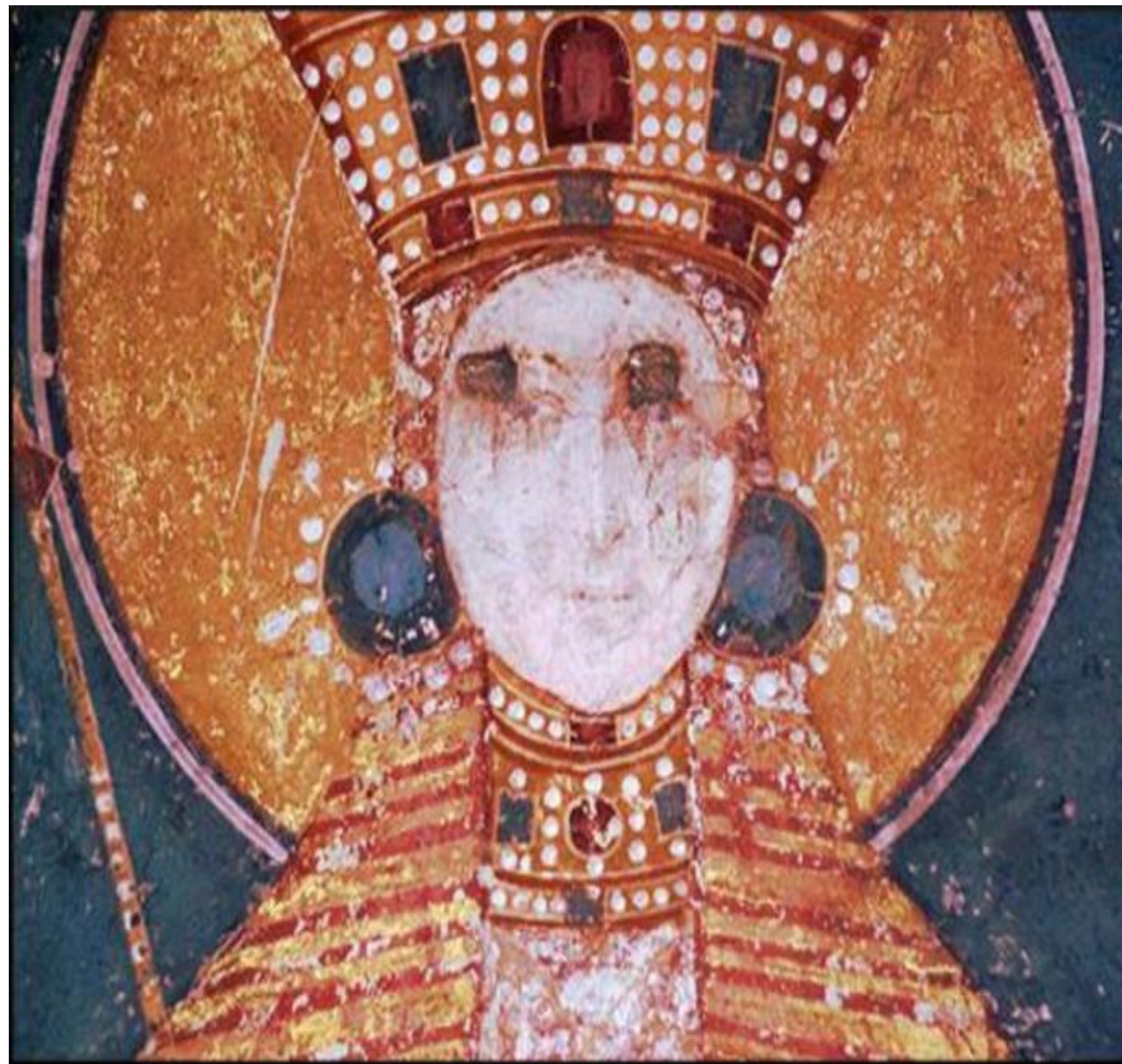
Фреска у Грачаници