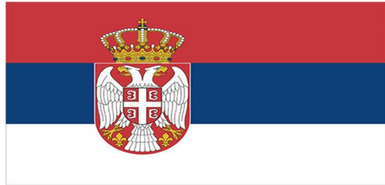
Државна застава Републике Србије

Народна застава је хоризонтална тробојка без грба.