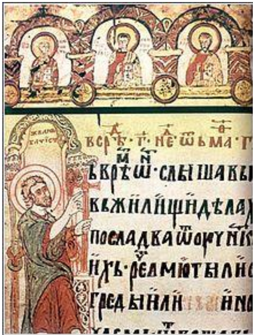
Miroslavljevo jevanđelje (12. vek)