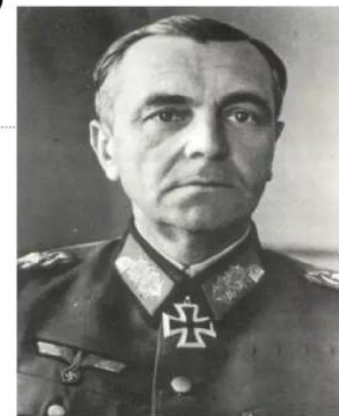
Фелдмаршал Фридрих фон Паулус.

Први заробљени највиши официр Вермахта током Другог светског рата.