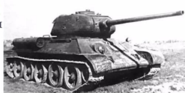
T-34 76/85 – Најбољи тенк Другог светског рата

Први заробљени највиши официр Вермахта током Другог светског рата.