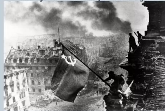
Совјетска застава на Рајхстагу