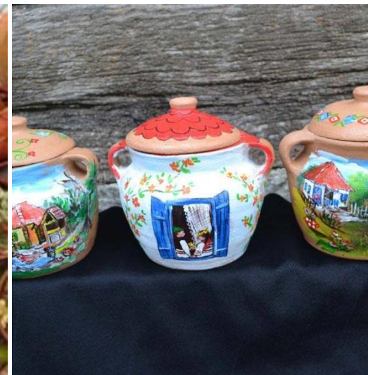
Нематеријално културно наслеђе