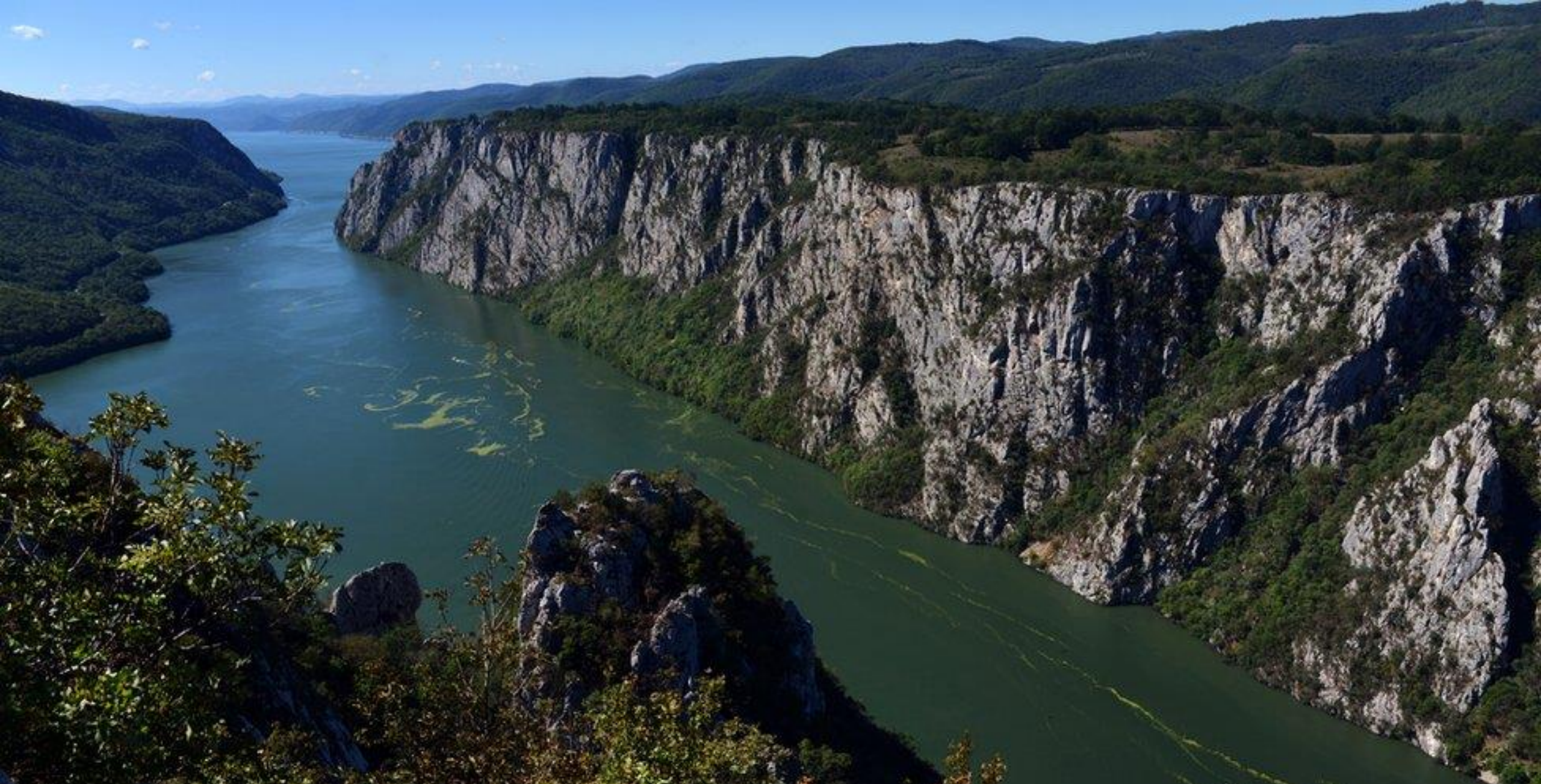
Национални парк Тердап